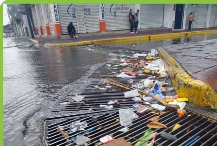
Evitar a toda costa acumulaciones de agua y basura

Por lo pronto, SIFSA recomienda a la población las siguientes medidas: