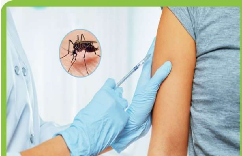
COFEPRIS indicó que la vacuna contra el dengue no debe usarse en niños menores de 9 años y personas mayores de 45.

Destacaron que la vacuna Dengvaxia solo se puede administrar a niños mayores de 9 años, según Sanofi Pasteur, fabricante de la vacuna. También señalaron que vale la pena recordar que la Comisión Federal para la Protección contra Riesgos Sanitarios (COFEPRIS) emitió al respecto un aviso de Riesgo sobre esta vacuna tetravalente, que está indicada únicamente para población a partir de 9 años de edad cumplidos y hasta los 45 años. Este aviso fue emitido luego de que se detectó la aplicación a menores de 9 años.